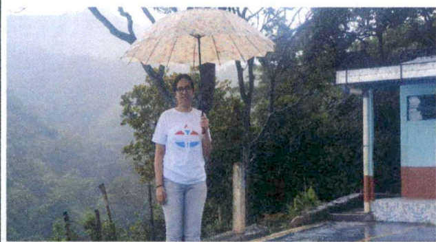
Foto1: Foto consultor